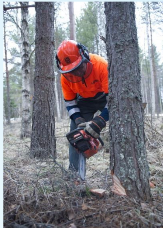
Träd och djur