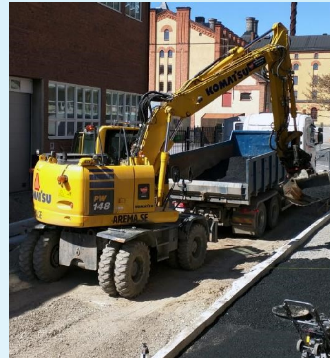
Mobila maskiner och arbetsfordon