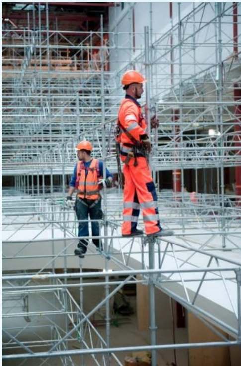
Fall från höjd